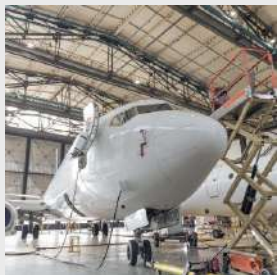
Aéronautique / Aérospatial